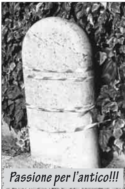
Passione per l'antico!!!