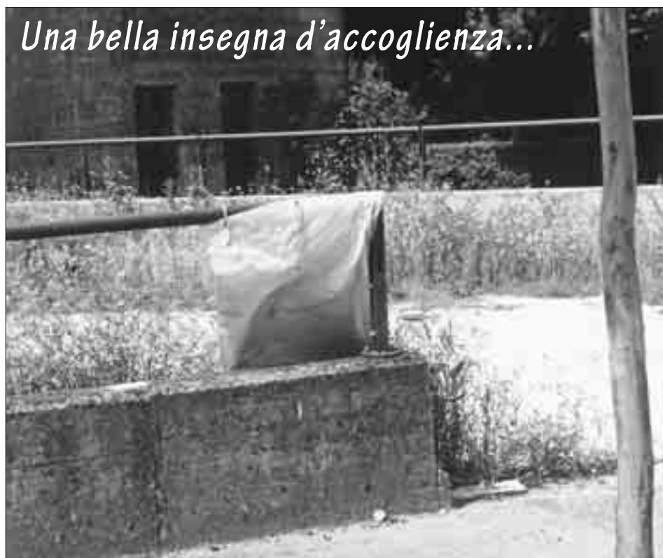
Una bella insegna d'accoglienza...